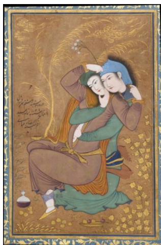
شکل ۵. عشاق، آبرنگ روی کاغذ، ۱۸/۱۱/۹ سانتی‌متر، موزه هنری متروپولیتن، منبع: (کنبی، ۱۳۹۳: ۱۵۳)

«این اثر جدای از القای حس حسرت خوردن بر تجارب عاشقانه گذشته، ممکن است بازنمای عشق انسانی به گونه تمثیلی از عشق الهی باشد که از مضامین رایج اشعار عارفانه است. دم غنیمت شمری و شوق وصال معبود را کمتر تصویری چون حالت مبهم و دو پهلوئی این دو پیکره می‌توانست تجلی دهد» (کنبی، ۱۳۹۳: ۱۵۷-۱۵۸). در این نگاره نیز همانند اکثریت آثار رضا، فرم قرارگیری پیکره‌ها و حالت نشستن آنها به صورت دوار و منحنی است (شکل ۷). گویی که هر دو پیکره بر روی یک قوس در حال