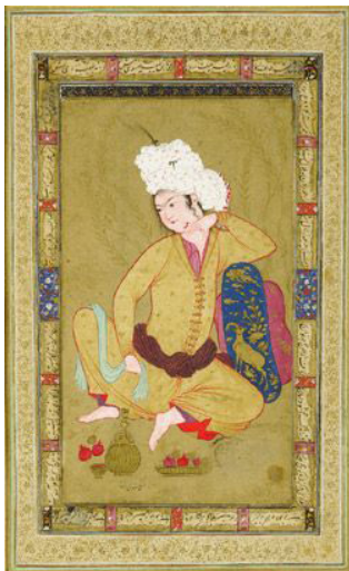
شکل ۱. جوان پابره‌نه، حدود ۱۰۰۸ ه.ق، آبرنگ روی کاغذ، ۱۴×۷ سانتی متر، بنیاد تاریخ هنر، هوستن، تگزاس، منبع: (کنبی، ۱۳۹۳: ۷۰)

خطوط روانی ایجاد شده توسط رد نگاه و اشاره انگشتان جوان، بیننده را از درون کادر نگاره به طرف فضای خارجی اثر هدایت می‌کند. جوان نشسته در حالتی خاص به بیرون از کادر نگاه می‌کند و با اشاره انگشتان، بر زاویه دید خود تأکید می‌نماید (شکل ۲). گویی جوان در انتظار لحظه‌ای دیگر، به انتظار معشوق و یا در انتظار دیدن جلوه‌ای دیگر از آفرینش است. اشاره و نگاه به سمت خارج از کادر برای بیننده می‌تواند نشان از زمان دیگر باشد. همانطور که می‌دانیم زمان از حرکت به وجود می‌آید. اشاره انگشت به خارج از کادر نیز همانند سمت و سوی نگاه پیکره، حرکتی را ایجاد می‌نماید که بیننده را به بیرون، زمان و مکانی دیگر هدایت می‌کند. این صورت از تجلی حرکت، باعث خلق زمان در اثر از یک سو و افزون بر آن، اشاره به زمان دیگر دارد. با فرض