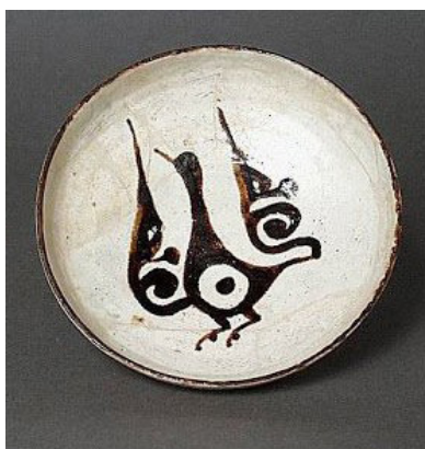
شکل ۹، نقش پرنده در قالب اسلیمی؛ کاسه خاکی مکشوفه از نیشابور، دوره ساسانی، قرن دهم، موزه هنر لس‌آنجلس، لس‌آنجلس.

نیشابور یکی از مهم‌ترین شهرهای قرون اولیه دوران اسلامی ایران بوده است. کاوش‌های نیشابور، مطالب مهمی را برای تاریخ تزئینات هنر اسلامی در قرن سوم و چهارم به همراه داشته است. الواح گچ‌بری متعددی که در این منطقه یافت شده، تزئینات غنی از نقوش بال‌های بسیار ساده شده را نشان می‌دهد (شکل