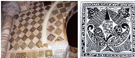
شکل ۵. کاشی‌های زرین‌فام، محراب مسجد قیروان تونس، بغداد سده سوم هجری (زمان سلطنت هارون الرشید).