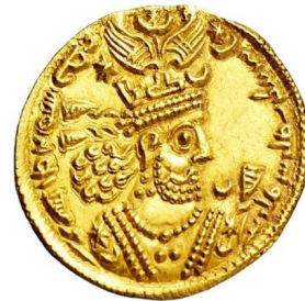
شکل ۳. سکه طلا، خسرو دوم ساسانی ۵۹۱-۶۲۸ میلادی.

مرکز خلافت در عصر عباسیان (۷۴۹-۱۲۵۸) از شهر دمشق به شهر تازه تأسیس بغداد در نزدیکی تیسفون، پایتخت ساسانیان