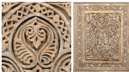
شکل ۸. نقش بالی شکل، گچ‌بری، نیشابور، سده چهارم هجری، موزه متروپلیتن نیویورک.