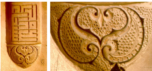
شکل ۱۲. نقش بال، گچ‌بری، بقعه پیر بکران در لنینجان، نزدیک اصفهان، سده ۸ هجری، دوره ایلخانی.