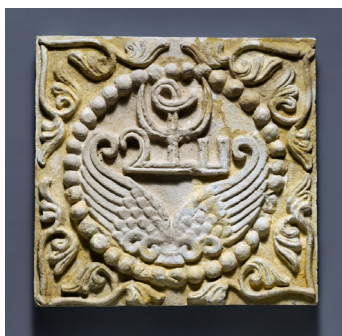
شکل ۲. نقوش بال، پلاک گچ‌بری، تیسفون، دوره ساسانی (۲۲۴-۶۴۲ پس از میلاد)، نیویورک، موزه هنر متروپولیتن.

ریگل، خاستگاه نقش اسلیمی را به گیاهی که ریشه در تزئینات نخلی و پیچک کلاسیک باستان (یونان) دارد، ارجاع می‌دهد (Riegl, 267, 1992). ارنست هرتسفلد ادعا می‌کند که منشأ آن مطمئناً از تزئینات شاخ و برگ کلاسیک گرفته شده است (Herzfeld, 363, 1938). ارنست کونل ریشه‌های نقش اسلیمی را تا اواخر دوران کلاسیک باستان دنبال می‌کند و خاطر نشان می‌کند که شکل معمولی خود را در قرن سوم هجری تحت حکومت عباسیان (۷۴۹-۱۲۵۸ پس از میلاد) به دست آورد و در قرن پنجم به طور کامل توسعه یافت (Kühnel, 561, 1960). آرتور پوپ پیشنهاد می‌کند که نقش اسلیمی ایرانی به هیچ وجه نشان‌دهنده هیچ شیء واقعی در طبیعت نیست، بلکه از زیور معماری زیبای یونانی، آنتیمون (پالمتو) گرفته شده است (پوپ، ۳۹، ۱۳۵۶).