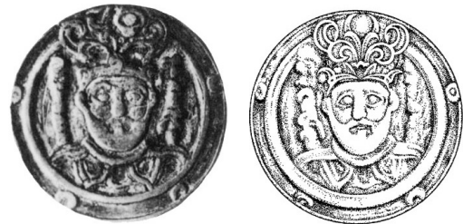
شکل ۱۰. مدال یا سکه، نقره، بویید (رکن‌الدوله) ۹۶۲ میلادی، نیویورک، انجمن سکه‌شناسی آمریکا.