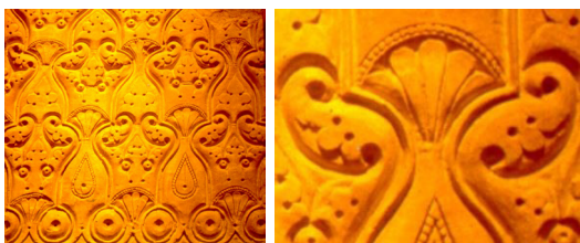
شکل ۶. لوح گچ‌بری، سامرا، دوره عباسی (۷۴۹-۱۲۵۸)، نیویورک، موزه هنر متروپولیتن.