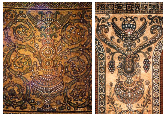
شکل ۴. نقش بال، قبه الصخره (۶۹ هجری)، دوره امویان.