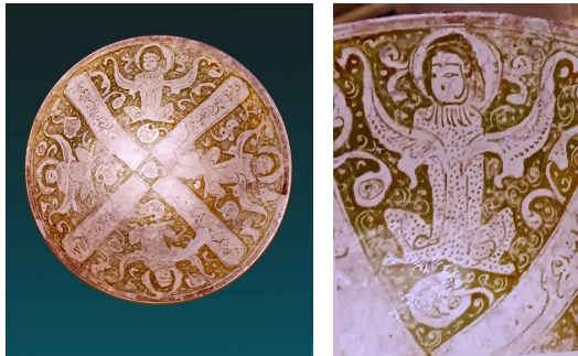
شکل ۱۱. نقش چهار فرشته، کاسه سفالی زرین‌فام کاشان، دوره سلجوقیان سده هفتم هجری، موزه آگینه تهران.

همه این نمونه‌ها، مراحل مختلف ساده‌سازی نقوش بال را نشان می‌دهند که برگرفته از نمونه اولیه ساسانی است، زمینه را برای خلق اسلیمی مهیا کرده است. این عناصر تزئینی در دوره‌های بعد نیز به رشد خود ادامه دادند و به نظر می‌رسد که به شکل فوق‌العاده‌ای تلطیف شده و به نقش اسلیمی، شاخه‌ای مهم از تزئینات در هنر ایرانی ابداع شد. نفوذ هنر باستانی یونانی - رومی ممکن است در بخش‌های از هنر غربی جهان اسلام قابل دریافت باشد، اما در بخش‌های مرکزی و شرقی جهان اسلام، نفوذ