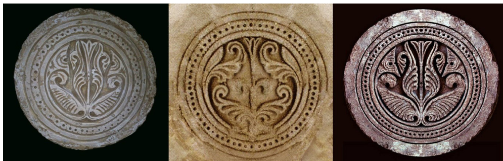
شکل ۷. نقش بال، گچ‌بری، مسجد جامع سیمره، قرن سوم، (لک‌پور، ۱۳۸۹)

۸). همچنین مقدار قابل توجهی از سفال‌های این دوره نیز در نیشابور کاوش شده است. این سفال‌ها چندین شیوه تزئینی را نشان می‌دهند. از جمله عنصر رایج بال که بسیار ساده شده و در آنها اسلوب واقعی شکل‌گیری نقش اسلیمی برداشت می‌شود. ترکیب نقش اسلیمی با نقوش حیوانی یکی از مجرب‌ترین شیوه طراحی در این دوره است. متداول‌ترین آنها نقش حیوانی است که در قالب و صورت نقش اسلیمی ترسیم شده است. رایج‌ترین آنها نقش پرندگان است. در اینجا بال‌های پرنده کاملاً به صورت نقش اسلیمی نمایش داده شده است (شکل ۹). فضای خالی روی بدن پرنده نقش مهمی در ایجاد تعادل بین شکل بال و بدن و همچنین هویت بخشی طراحی نقش در قالب اسلیمی را ایجاد کرده است. قابل ذکر است این شیوه تزئینی که فرم بال پرنده در قالب اسلیمی شکل گرفته در تزئینات منسوجات آل‌بویه هم دیده می‌شود. در طول حکومت آل‌بویه (۳۲۰-۴۵۴ هجری) حیات هنری در ایران بسیار شکوفا می‌شود. در این دوره، نقش اسلیمی به شکل توسعه‌یافته‌تری ظاهر می‌شود. نقوش بال را می‌توان در تزئینات