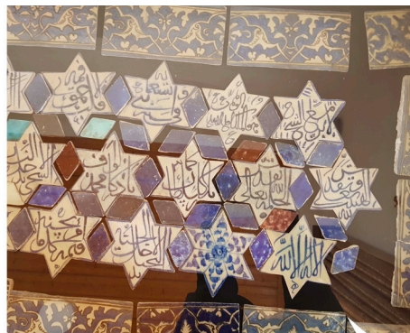
تصویر ۲. کاشیکاری داخلی ازاره در طول زمان؛ از چپ به راست: الف. سال ۱۳۵۵ (ستوده، ۱۳۷۴: پیوست)، ب. سال ۱۳۹۳، ج. سال ۱۴۰۲ (در موزه تاریخی آمل)