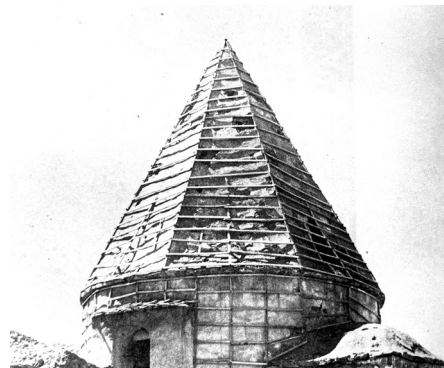
تصویر ۳. گنبد مخروطی، عکس از منوچهر ستوده ۱۳۵۵. (ستوده، ۱۳۷۴)

مشهور فلاسفه، حرکت در مقوله جوهر را نپذیرفته و فقط به حرکت در چهار مقوله عرضی کم، کیف، آیین و وضع قائل بوده‌اند. اما حکیم صدرالمآلهین شیرازی، معتقد است که حرکت منحصر به أعراض نبوده بلکه در جوهر و ذات اشیاء نیز جاری است (طباطبایی، بی‌تا: ۱۲۸). او در مجلد سوم کتاب اسفار، به تفصیل و بر اساس دلایل عقلی و نقلی، اثبات کرده است که صورت نوعیه به عنوان گوهر و ذات شیء، پیوسته تبدیل می‌یابد و به تکامل می‌رسد.