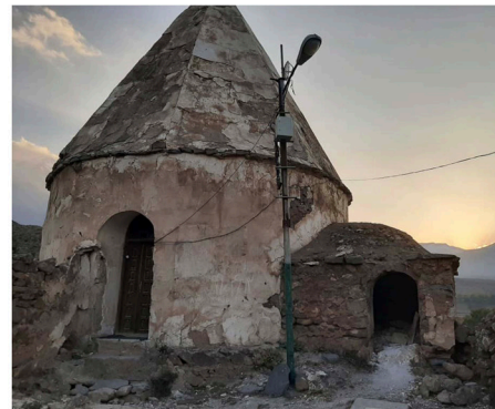
تصویر ۱. بنای ساده گچ‌کاری شده در طول زمان؛ از چپ به راست: الف. سال ۱۳۵۵، عکاس: منوچهر ستوده (ستوده، ۱۳۷۴: پیوست)، ب. سال ۱۳۹۳، عکاس: نامشخص، ج. عکاس: نگارنده (در حاجی دلا، ۱۴۰۲).