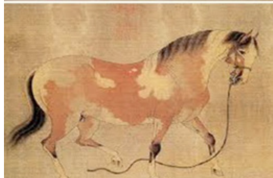
تصویر ۴. دو اسب اثر رن رنفا (جیایی و چونگ جنگ، ۱۳۹۴: ۹۹)