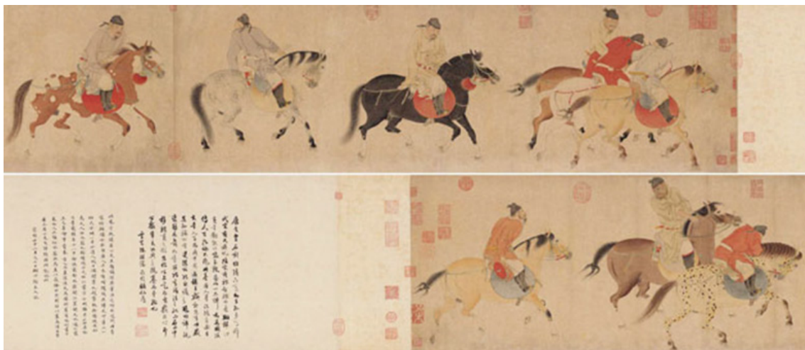
تصویر ۱. بازگشت پنج شاهزاده مست با اسب، اثر رن رنفا (URL1)

به هنگام فوت غازان خان در سال ۷۰۳ ه. (۱۳۰۴ م.) بسیاری از مشکلات تسلط هفتاد ساله مغولان مرتفع شده بود. پس از مرگ غازان خان، وزیر باتدبیرش یعنی خواجه رشیدالدین که بانی بسیاری از این اصلاحات بود، در امارت ابقا شد، تا راهی را که آغاز کرده بود به اتمام رساند. شاید یکی از علل رشد و شکوفایی هنر و ادب در زمان وی، امنیتی بود که در دوره غازان خان فراهم آمده بود. «خواجه رشیدالدین مجتمعی را به نام ربیع رشیدی در تبریز بنا کرد که کارگاه‌ها و کتابخانه‌های آن در نخستین سال‌های قرن هفتم هجری، تولید نگارش و مصوّرسازی بسیاری از کتب تاریخی، ادبی و علمی را به عهده داشتند» (پاکباز، ۱۳۸۹: ۶۰). در دوره یوان گروهی از هنرمندان و صنعتگران چینی مجبور به ترک وطن شدند. نقاشان، دیگر منظره را نه پناهگاهی با صفا و آرام، بلکه جزئی از محیط سرسخت و واقعی می‌دانستند. به دلیل سلطه بیگانگان مغول، نقاشان دیگر تمایلی به کار در دربار حکومتی را نداشتند و نقاشی‌های خیزران، در این دوره مخصوصاً مورد توجه بودند. ۱۲ سبک نقاشی آن‌ها نسبت به گذشته تغییر کرد و موضوعات فردی، جایگزین طبیعت‌گرایی محض شد. «در طول دوره یوان، مغولان از دادن هر امتیاز سیاسی به دانشمندان ممانعت می‌کردند و آن‌ها برای بروز احساسات خود پرندگان و حیوانات را به تصویر می‌کشیدند، همین امر تبدیل به یک دوره مهم ترقی در نقاشی ادبا در تاریخ چین شد» (Geng Mingsong, 2008: 3). هنر در ادوار مختلف تاریخی نقش بسیار عمده‌ای در گسترش فرهنگ ایفا کرده. در آن زمان بسیاری از مناسبات اقتصادی و سیاسی به کمک سیستم حمل‌ونقل اسب‌ها انجام می‌پذیرفت و «اقتصاد چین و چادر نشینان در شمال آسیا و آسیای میانه به وسیله حرفه سوارکاری به هم متصل می‌شد» (Xu Z, 2015:).