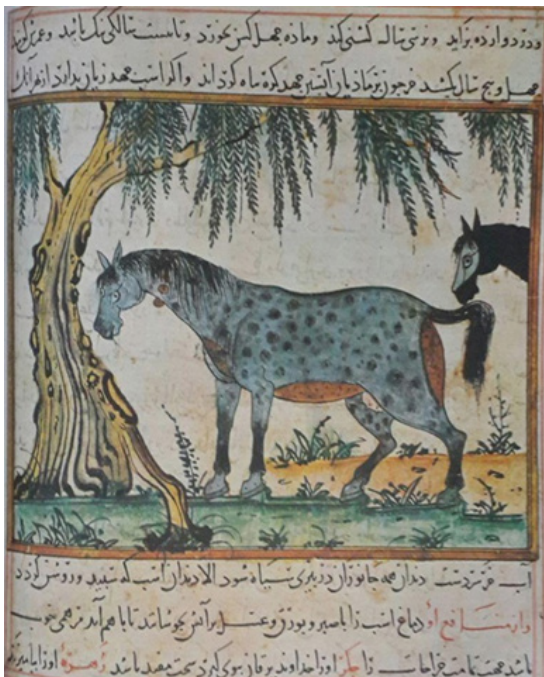
تصویر ۵. نگاره اسب و مادیان برگرفته از کتاب منافع الحيوان ابن بختیشوع؛ تعقیب مادیان به وسیله اسب نر مراغه، ۱۲۹۸. (گری، ۱۳۹۲: ۱۵۴)

نقش اسب در اساطیر و فرهنگ ایرانی از اسطوره آغاز هستی