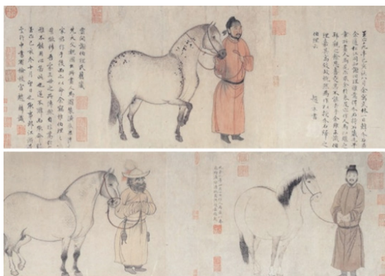
تصویر ۳. دامادها و اسب‌ها (Grooms and Horses) اثر جانو یونگ سلسله یوان (Fong, 1992: 432)

حال یورتمه دیده می‌شوند. این اثر حالت‌های مختلف اسب با رنگ‌های متفاوت را به نمایش گذاشته است. تنوع فرم بدن اسب در آن‌ها به خوبی مشاهده می‌شود و حالت فیگورها با دوره‌های قبلی تفاوت دارد. علت پرداختن به موضوعاتی این چنین، شاید یورش مغولان به سرزمین چین و تاخت و تاز آن‌ها بوده و نقاشان با انتخاب این چنین سوژه‌هایی آثار تخریبی حمله به چین را نمایش داده‌اند (تصویر ۱). جانو منگ فو بلندمرتبه‌ترین نقاش رسمی این دوره نیز عمدتاً در انزو نقاشی می‌کرده است. «دوره یوان به دلیل همین اتفاقات سیاسی و اجتماعی، آغازگر دوره فردیت و نوآوری در هنر بود. در نقاشی، حتی به‌رغم قیودی که سنت‌های نقاشی منظره بر دست و پای نقاشان دوره یوان بسته بود، آنان نمی‌توانستند در این مکتب کلاسیک به نوآوری‌هایی دست بزنند، لیکن راه را هموار کردند تا نقاشان بعدی تحولات بیشتری ایجاد کنند. این گروه نقاشان منظره، از قرار معلوم واریاسیون‌هایی بر درون مایه‌های واحد خلق کردند» (تریگیر، ۱۳۹۵: ۱۴۲).