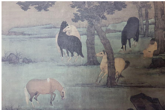
تصویر ۲. بخشی از نگاره اسب‌ها، اثر جانو یونگ سلسله یوان نقاشی بر روی ابریشم (Geng Ming song, 2008: 3)

«داماد و اسب» (تصویر ۳)، یک طومار دستی است که سه جفت اسب و داماد را نشان می‌دهد که اولین اثر آن در سال ۱۲۹۶ توسط منگ فو، دو جفت دیگر آن به سال ۱۳۵۹ توسط پسرش جانو یونگ و نوه‌اش جانو لین کشیده شده است. جانو منگ فو، پس از ۶۳ سال این طومار کاغذی را به اداره نظارت مأمورین