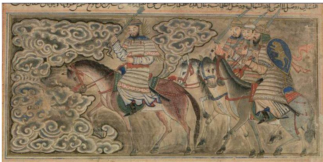
تصویر ۷. برگی از جامع‌التواریخ، دوره ایلخانی، تبریز، ۱۳۱۴؛ نقاشی آبرنگ با ورق طلا و نقره مات روی کاغذ، کتابخانه دانشگاه ادینبورگ. (URL 3)

در تمام این صفحات اول، حیوانات مطابق با علم جانورشناسی کشیده شده‌اند ولی منظره پشت آن‌ها که در صفحات آخر ماهرانه‌تر است با تصاویر بزرگ بیشتر هماهنگی دارند تا تصاویر کوچک. در اینجا برای بار اول نقاش سعی کرده نقاشی را همانند سنت دیرینه نقاشی‌های گل و پرندۀ چینی با کادر قطع کند. در سایر آثار مکتب مغول در ایران، مشاهده می‌شود که به چه طریق جالبی این امر رعایت شده است. اما در این زمان سنت قدیم به‌قدری قوی بود که اغلب مانع از اجرای آن می‌شد. ابرها اغلب طلایی هستند و کناره آن‌ها رنگ‌آمیزی شده است و از نظر طراحی به‌طورکلی غیرطبیعی‌اند. عظمت این مینیاتورها در تعادلی است که بین حالت ناتوراالیستی و مونومانثال در طراحی از حیوانات به چشم می‌خورد. حتی مونومانثال‌ترین ۲۳ صفحات که شامل ۲۴ ورق اول می‌شود به حیوانات مکانی برای زندگی کردن می‌دهند (تصویر ۵). به‌رحال هر قدر هم درختان و گل‌ها تزئینی به نظر برسند ولی باز هم سمبل مطلق نیستند بلکه به خارج از حاشیه نیز کشانده شده‌اند زیرا خاصیت رشد آن‌هاست. بنابراین آن‌ها پرکننده فضا نیستند بلکه علی‌رغم حالت مصنوعی و بدون شک تخیلی‌شان عنصر تشکیل‌دهنده مکان برای حیوانات‌اند. در صفحات آخر کالیگرافی به شیوه چینی کمتر استفاده شده و بنابراین به سنت