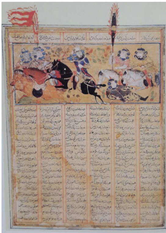
تصویر ۸. اسفندیار گرگسار را به زیر می‌افکند. شاهنامه فردوسی در قطع کوچک، قرن هشتم هجری. (کن بای، ۱۳۹۱: ۳۱)

هرچند شاهنامه‌های کوچک چندان تأثیری بر نگاره‌های