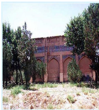
تصویرهای ۴ و ۵. ورودیه رباط ایش خاتون.