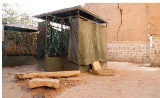
تصویر ۶. مقبره آیش خاتون.

به همین دلیل می‌توان گفت زمینه هنر قرن هفتم هجری شیراز، که در طی سالیان بعد به بار نشست، حتی در انتزاعی‌ترین شکل خود، هنری وابسته است؛ این هنر، از سویی با دین و از سوی دیگر با اهدافی اجتماعی و سیاسی پیوند دارد. بدیهی است که تعلق خاطر درباریان به هنر و به تعبیری ذوق‌ورزی ایشان، که خصیصه عمده دربارهای شیراز در قرون چهارم و هفتم به شمار می‌رود، در صورت نهایی آثار هنری اثرگذار بوده است؛ چنان‌که تعهدات دینی نیز چنین تأثیراتی در هنر بر جای گذاشته است.