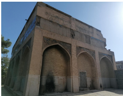
تصویرهای ۲ و ۳. رباط ایش خاتون، جنوب شرقی شیراز.