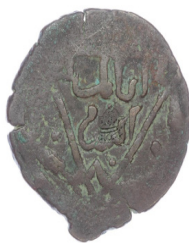
تصویر ۱. سکه‌های آیش‌خاتون، موزه ملک: (URL3).