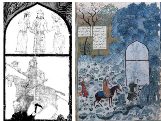
تصویر ۳. نگاره دیدار شیرین با فرهاد در بیستون، نسخه خسرو و شیرین، fol.68v، اواخر ۸ ق، جلایری، گالری هنر فریر، F1931.35 (URL1)؛ چپ: بزرگ‌نمایی صخره‌نگاره فرهاد در نقاشی.