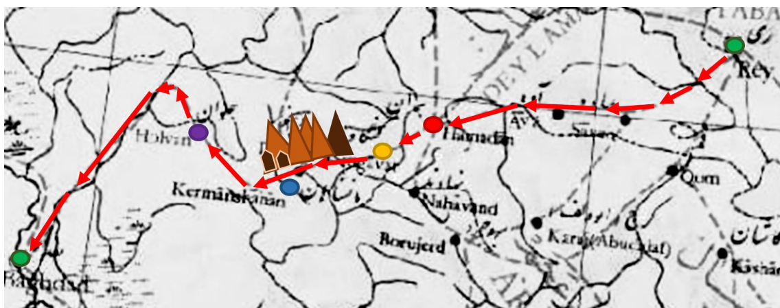
تصویر ۹. بخشی از جاده نیشابور-بغداد؛ کوه‌های پَرّو (بیستون، مثلث تیره و طاق‌بستان، روی آخرین کوه)، و ری (دایره سبز راست)، همدان (قرمز)، کنگاور (زرد)، قرمیسین (آبی)، حلوان (بنفش)، بغداد (سبز چپ) روی نقشه مشخص‌اند (نصر و همکاران، ۱۳۵۰: ۱۵). (PI.15)

سراغاز ورود به دنیای نویسندگان دوره اسلامی، سفر از جاده کهن ری به بغداد است. هم‌گامی با بیندگانی که پس از همدان و کنگاور به سوی حُلوان، در حوالی قرمیسین با کوه شگفت‌انگیز