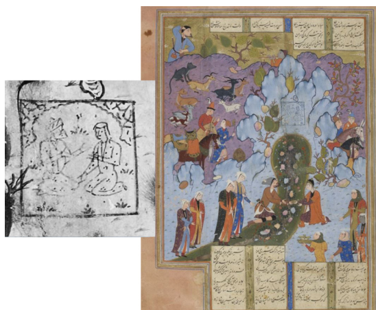
تصویر ۸. «رفتن شیرین به بیستون»، خمسه، fol.57r، ۹۶۸ق، کتابخانه فرانسه، (URL7) Persan1956.

۳. نقاشی‌ها بدون همبستگی با نقش‌برجسته‌های تاریخی: الگوی بزم دودل‌داده که پیش‌تر از آن گفتیم (تصویر ۶)، در برگه 47r خمسه‌ای از واپسین سال‌های سده ۹ق. (۸۹۷ق، کتابخانه فرانسه، Per171)، به‌تنهایی در یک قاب مربعی محراب‌مانند نشسته است. ۱۴ این نگاره کم‌وبیش، پیشاهنگ همه نگاره‌های سده ۱۰ق. است که رها از متن نظامی و سنت تصویری نگارگران پیشین، نمایی از هم‌نشینی دو دل‌باخته را بی‌هیچ یادآوری تاریخی نشان می‌دهد. همچنین از چگونگی بازنمایی صخره‌نگاره فرهاد در آثار سده‌های ۹-۱۰ق. درمی‌یابیم که هنرمندان بر سر جایگاه این نقش در تصویرگری داستان، نگاه ناهمگونی داشته‌اند؛ برخلاف هنرمندان پیشاصفوی که با الگوبرداری از نقش‌برجسته‌های موجود و نمایش ریزپردازانه آن‌ها، بخشی از روایتگری دیداری