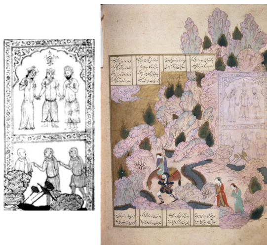
تصویر ۷. «بردوش کشیدن شیرین»، خمسه، fol.63b، ۸۶۶ق، توفایی‌سرای، 761 Hazine (URL6).