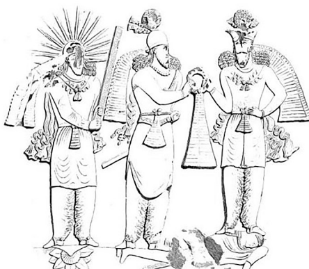
تصویر ۲. نقش‌های طاق‌بستان؛ ردیف ۱: نمای ایوان بزرگ؛ پیشانی: بالا، تاج‌بخشی آناهیتا و اورمزد (Flandin, 1851: Pl.9)؛ پایین: سوار (Flandin, 1851: 8)؛ دوسو: شکارگاه‌ها، (Flandin, 1851: Pls.10&12)؛ ردیف ۲: راست، اردشیر (Flandin, 1851: 14)؛ چپ، تک‌نقش طاق کوچک (شاپورها) (Flandin, 1851: 13).