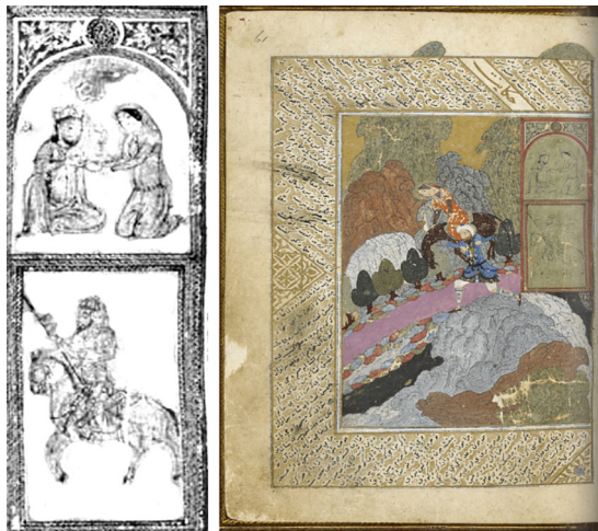
تصویر ۴. نگاره «به‌دوش کشیدن شیرین»، گلچین اسکندرسلطان، fol.61r، آغاز ۹ ق، شیراز، کتابخانه بریتانیا، Add.27261 (URL2).

دو نگاره تیموری، یکی از هرات (fol.70r، ۸۴۶ ق، کتابخانه بریتانیا، Add.Ms.25900) و دیگری از شیراز (fol.44v، ۸۶۰ ق، کتابخانه فرانسه، Per1112) نیز در اجرای نقش صخره‌نگاره فرهاد به‌مانند خمسه جلایری، شباهت چشم‌گیری به نقوش طاق‌بستان دارند. در نگاره هرات، حتی سویه اسب با نقش طاق‌بستان (از چپ به راست) همانند است. البته این نگاره از آن نسخه‌ای است که برخی بخش‌های آن را هنرمندان صفوی بازپرداخته‌اند. شیوه رنگ‌آمیزی بستر صخره‌نگاره و برخی دگرگونی‌ها در لباس پیکره‌ها، گمان بازسازی این بخش را بیشتر می‌کند. می‌پنداریم این طرح به‌مانند صخره‌نگاره خمسه جلایری (تصویر ۳)، الگوپردازی وفادارانه‌ای از طاق‌بستان بوده که در بازپرداخت صفوی، در پاره‌ای ریزنگاری‌ها دگرگون شده است. به‌ویژه آنکه سنت خمسه‌پردازی صفوی، آنگونه که خواهیم دید،