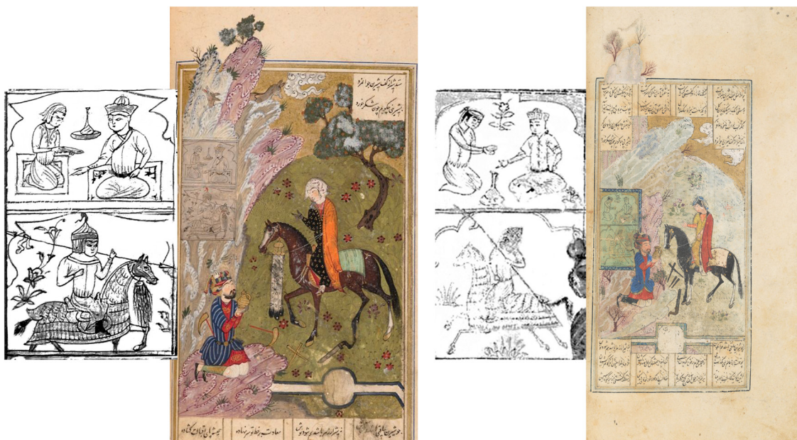
تصویر ۶، راست: «شیرین پیاله شیر را به فرهاد می‌دهد»، خمسه، ۸۹۴ ق، شیراز، هاروارد، (URL4) 9.2015.77؛ چپ: «شیرین پیاله شیر...»، خمسه، (URL5) Ms.Elliott 192، fol.73b، ۹۰۶ ق (ترکمان)، شیراز؟، بادلیان، (URL5)

نگارگران پیشاصفوی، نقش سوار را در صخره‌نگاره