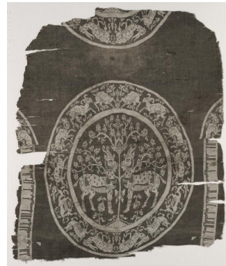
تصویر ۲: پارچه روپوش قبر. ۷۸/۱×۶۶ سانتی‌متر. متعلق به دوران میانه اسلامی به سبک هنر ایران پیش از اسلام. موزه هنری کلیولند (URL2).

رواج یافت، سبب محفوظ ماندن این پارچه‌ها از گزند روزگار گردید زیرا کلیساها خواهان استخوان پارسیان مسیحی و حفظ و نگهداری آن‌ها شدند و برای نقل و انتقالشان از شرق به غرب، آن‌ها را در ابریشمین‌های پر بها می‌پیچیدند. به اعتقاد پژوهش‌گران، این ابریشمین‌ها در قرن‌های اول تا سوم میلادی بافته شده است و هم‌اکنون قطعاتی از آن را با نقش‌های سیم‌غ و سر گراز و حیوانات دیگر وجود دارد» (تصاویر ۱ تا ۳) (غیبی، ۱۳۹۵، ۲۳۱).