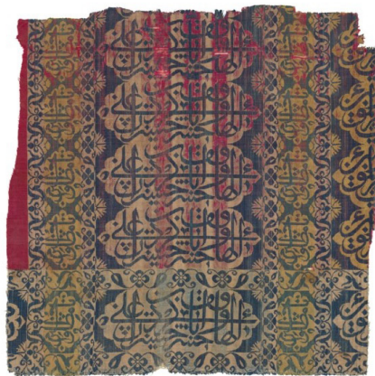
تصویر ۱۳: بخشی از پارچه روپوش قبر. اوایل سده دوازدهم ق. ۵۱×۵۲ سانتی متر. حراج کریستی (URL8).