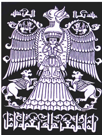
تصویر ۶: بخشی از روپوش قبر سده پنجم یا ششم. بلندی: ۱۳ سانتی متر (پوپ و اکرم، ۱۳۹۴، ۵/۲۳۲۶).

(تصویر ۶) در نمونه‌ای دیگر که بخشی از آن در مجموعه خصوصی و بخش دیگری در موزه ویکتوریا و آلبرت لندن نگهداری می‌شود و مربوط به نیمه دوم سده ششم قمری است؛ نقش پارچه، تفسیری موزون و پرمعنا را در بر می‌گیرد: دو جوان شبیه به یکدیگر که در دو طرف سروی مقابل حوض آبی نشسته‌اند (تصویر ۷). سرهای این دو جوان حالت خمیده‌ای دارد که به دست‌هایشان تکیه داده شده است. این نقش مایه را یک ردیف حاشیه کتیبه کوفی و تزیینات گیاهی پیچکی قاب کرده است. مفهوم این نقش درباره مرگ است و به این ترتیب چنین استنباط می‌شود که این پارچه ابریشمی برای پوشش قبر بافته شده است. این مفهوم با عقاید و برداشت ایرانیان از جهان آخرت و بهشت ارتباط می‌یابد (پوپ و اکرم، ۱۳۹۴/۵، ۲۳۲۵-۲۳۲۶).