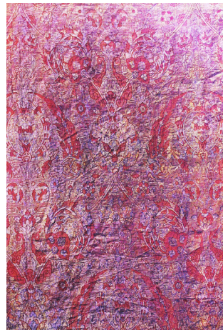
تصویر ۱۷: بخشی از پارچه روپوش قبر شیخ صفی. عمل خواجه غیاث. حدود ۱۰۰۰/۱۵۹۱. بلندی ۵۳ سانتی متر (پوپ و اکرمین، ۱۳۹۴، ۱۱/۱۰۳۶).