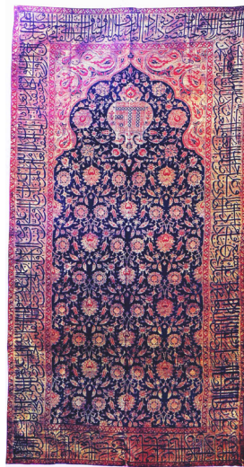
تصویر ۱۶: پارچه روپوش قبر شیخ صفی. عمل خواجه غیاث. حدود ۱۰۰۰/۱۵۹۱. بلندی ۲۳۵ سانتی متر. موزه ملی ایران (پوپ و اکرمین، ۱۳۹۴، ۱۱/۱۰۳۷).

روح‌فر، ۱۳۸۸، ۹۹). این پوشش قبر یکی از برجسته‌ترین آثار هنر پارچه‌بافی است که تا به حال شناخته شده است. با حالت شعف و طربی که از مشاهده این پارچه به وجود می‌آید به نظر می‌رسد که کاربرد آن به عنوان پوشش قبر نامناسب باشد ولی با وجود کتیبه‌ای که در حاشیه این پارچه وجود دارد می‌توان ربطی برای کاربرد آن یافت (پوپ و اکرمین، ۱۳۹۴، ۲۴۱۲/۵). عرض پارچه با این ابعاد در تاریخ نساجی آن دوران کم‌سابقه است. پارچه دارای سه ردیف حاشیه است. دو حاشیه منقوش به گل‌های