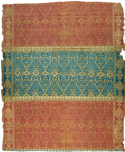
تصویر ۱۰: بخشی از پارچه مشهور به روپوش قبر. اوایل سده دوازدهم/ هجدهم. موزه ریذ (URL5).

قرآن؛ دعا و حدیث آشنا بودند قادر به انتخاب و تصمیم‌گیری در مورد آیات مذهبی برای بهترین و مناسب‌ترین محل بودند» (شایسته‌فر، ۱۳۸۴، ۵۲). در این تعبیر، وجود خط نوشتاری روی پارچه آن را از سایر بافته‌ها متمایز می‌ساخت زیرا پارچه را از استفاده عام به استفاده خاص تبدیل می‌کرد. در این میان خوشنویسی و کتابت آیات قرآن و ادعیه روی پارچه از اجزای اصلی تفکیک پارچه‌های آیینی از سایر منسوجات شدند. وجود نوشتن آیات قرآنی و ادعیه بر پارچه ضمن اینکه به آن قداست داد نقش آیینی به پارچه نیز اضافه کرد تا جایی که پارچه این رسالت را پیدا کرد که به نوعی شیوه نگارش خط را در جریان تکامل خوشنویسی خود ثبت کند. اضافه شدن متون نوشتاری بر بافت و نقش پارچه بی‌شک انتخابی بی‌تفکر نبوده است. در ضمن همان‌طور که اشاره شد نوع خط و متن نوشتاری بر پارچه مصرف آنها را تعیین می‌کرد. این پارچه‌ها یا به عنوان لباس و خلعت استفاده می‌شدند یا کاربرد دینی مانند سجاده، لباس احرام، کفن، پوشش قبر و... داشتند. در دوره صفوی، پارچه‌هایی وجود دارد که به روال تاریخ دوران اسلامی ایران دارای ادعیه، سوره یا آیاتی از قرآن هستند. این شیوه از طراحی بر پارچه در میان مسلمانان از گذشته تاکنون همواره مورد احترام بوده است. ضمن اینکه نوشتن دعاهایی به خط عربی که به آن حرز و طلسمات گفته می‌شود به