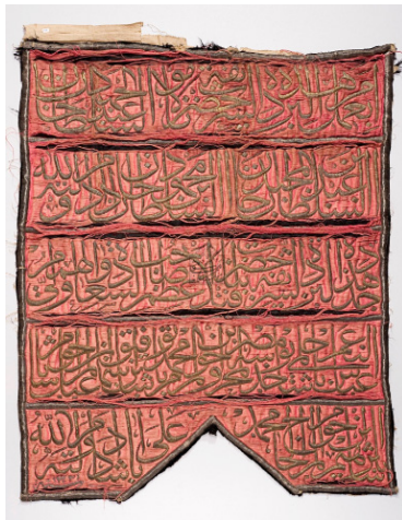
تصویر ۱۸: پارچه روپوش قبر. ۱۳۲۱ق./۱۹۰۳م. ۸۳×۶۵ سانتی متر. موزه ملی ملک (URL11).