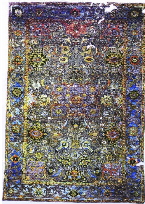
تصویر ۵: قالی گل و گیاهی ابریشمی. روانداز قبر شاه عباس دوم. ۱۰۸۲ ق. / ۱۶۷۱ م. موزه آستان مقدسه قم (پوپ و اکرم، ۱۳۹۴، ۱۲/۱۲۵۷).