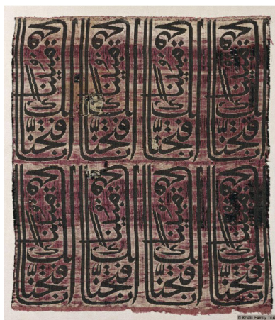
تصویر ۱۲: بخشی از پارچه مشهور به روپوش قبر. سده سیزدهم ق. ۴۰×۳۵ سانتی متر. مجموعه ناصر خلیلی (URL7).