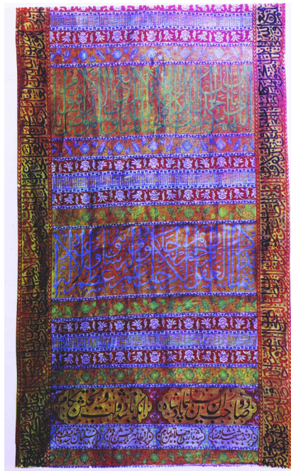
تصویر ۹: بخشی از پارچه مشهور به روپوش قبر امام رضا(ع). ۱۰۸۰ ق. / ۱۶۶۹ م. پهنای ۱۰۱/۶ سانتی متر. آستان قدس رضوی (پوپ و اکرم، ۱۳۹۴، ۱۱/۱۰۸۴).