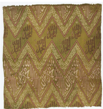
تصویر ۱۴: احتمالاً بخشی از پارچه روپوش قبر. سده دوازدهم و سیزدهم ق. موزه اسمیتسونین (URL9).

سبب، تا حدودی، تمام منسوجات ابریشمی کتیبه‌دار صفوی که از آن زمان تاکنون به خارج از کشور راه یافته، قبرپوش معرفی شده‌اند (تصاویر ۱۰ تا ۱۲)؛ اما شاه سلیمان در پارچه نذر شده مذکور، دو بار کلمه «شده» به معنای علم و بیرق ذکر کرده است (تصویر ۹). با این حساب اگرچه می‌توان کاربردهایی مانند علم یا پرچم، تابوت‌پوش و حتی قبرپوش را فرض کرد، توجه به محتوای این منسوجات و همچنین ساختار هندسی برخی از آنها و کاربری گسترده‌شان در آیین‌های مربوط به امام حسین (ع) ، مخاطب را بدین نکته رهنمون می‌کند که کاربرد اصلی بسیاری از آنها، علم عزاداری بوده که ممکن است به اشکال مختلف به‌کاررفته باشد (مشهدی نوش‌آبادی و غیاثیان، ۱۴۰۲، ۵۶) اما سبب شده تا در کلیت، بسیاری از پژوهشگران، هر نوع پارچه کتیبه‌دار طولی