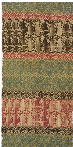
تصویر ۱۱: پارچه مشهور به روپوش قبر. ۱۱۲۲ ق. / ۱۷۱۰ م. ۶۸×۸۲ سانتی متر. مجموعه خصوصی (URL6).