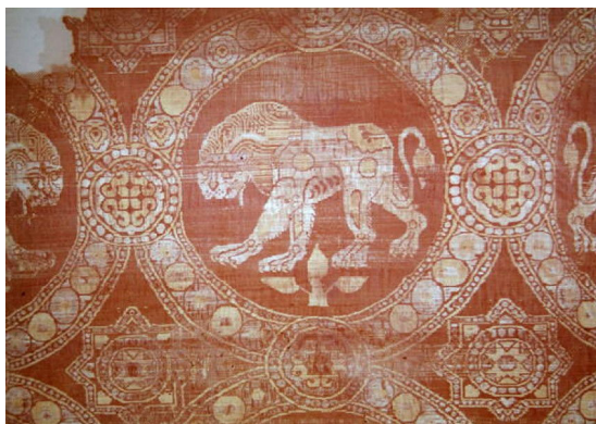
تصویر ۱: پارچه روپوش قبر. سده ۳ تا ۵ میلادی. مجموعه خصوصی (URL1).

در شکل تاریخی توجه به مفهوم حریم، سنت پوشش و تزئین مکان‌های مقدس و قبور به وسیله منسوجات نیز تاریخی بس کهن دارد. در نزد مسلمانان، خانه خدا یا همان قبله مسلمانان اولین مکان مقدسی است که با پارچه مستور شده است (فضل وزیری، ۱۳۹۸، ۱۴۴). «حضرت اسماعیل (ع) اولین شخصی بوده که بر کعبه جامه پوشاند، سپس «عدنان»، جد بزرگ پیامبر اکرم (ص) ، نخستین فردی بود که بعد از حضرت اسماعیل (ع) جامه را بر کعبه پوشانید لیکن این جامه‌ها به‌طور کامل نبوده است. تا با آمدن «تبع حمیری»، پادشاه یمن به مکه مکرمه جامه‌ای بر آن قرار داده شد. او نخستین شخصی بود که جامه کامل را بر کعبه مکرمه قرار داده است» (الدقن، ۱۳۸۴، ۸۲). کعبه در دوران جاهلیت به وسیله چندین جامه از پارچه‌های حبری، برده‌های یمانی و دیگر پارچه‌های بافت یمن و حتی قطعات خز، حبره و جامه‌های پشمین پوشیده می‌شد و هرگاه شخصی جامه‌ای را به کعبه هدیه می‌کرد آن جامه آویخته می‌شد و مابقی آن را در خزانه کعبه به ودیعت می‌سپردند؛ وقتی جامه روی کعبه آسیب می‌دید، جامه نوین دیگری را روی آن قرار می‌دادند و هیچ‌گاه جامه‌های پیشین را از روی آن بر نمی‌داشتند (ازرقی، ۱۳۹۳، ۱۹۴). بدیهی است باقی ماندن جامه‌های کهنه و مندرس بر اندام بیت‌الله الحرام مورد پسند هیچ انسان با ذوق و سلیمی نبود؛ هنگامی که اسلام ظهور کرد و سطح زندگی اجتماعی آنان پیشرفت نمود مسلمانان به هنگام قرار دادن جامه