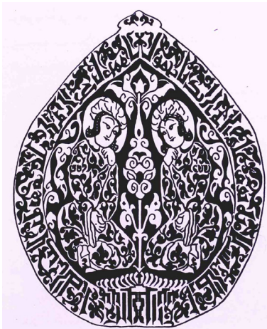
تصویر ۷: بخشی از روپوش قبر سده ششم. بلندی: ۱۸/۴ سانتی متر (پوپ و اکرم، ۱۳۹۴، ۵/۲۳۲۵).