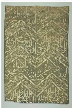
تصویر ۱۵: احتمالاً بخشی از پارچه روپوش قبر. سده سیزدهم ق. موزه اسمیتسونین (URL10).