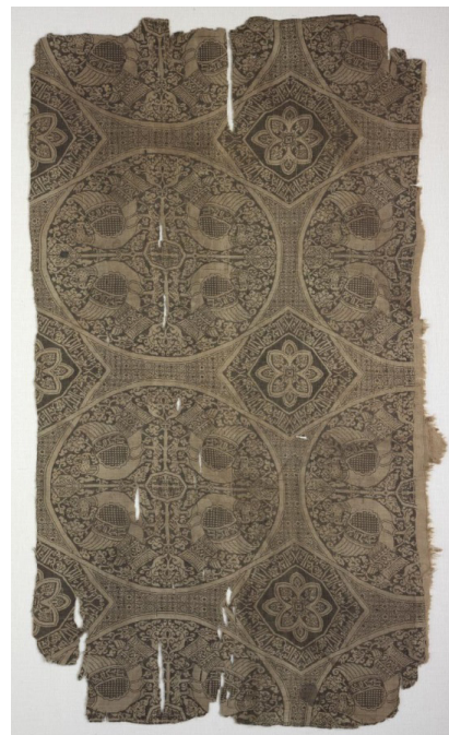
تصویر ۳: پارچه روپوش قبر. ۴۴۶-۳۴۳/۱۰۵۵-۹۴۵/۳۸،۵×۶۷ سانتی‌متر. به سبک هنر ایران پیش از اسلام. موزه هنری کلیولند (URL3).